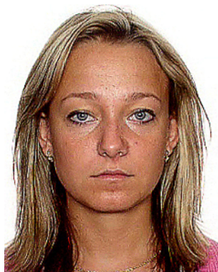
widoczna struktura pixeli