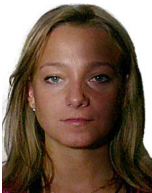
cień na twarzy