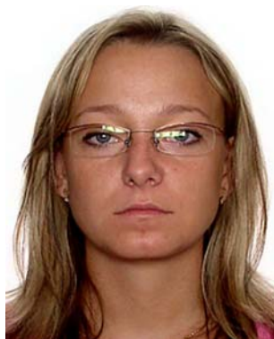
refleksy w okularach