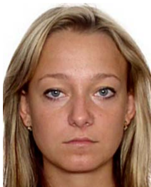
za duża głowa