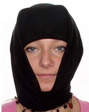
cienie na twarzy