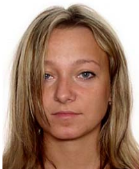
włosy zasłaniają twarz