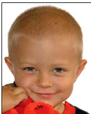
zabawka zakrywa część twarzy