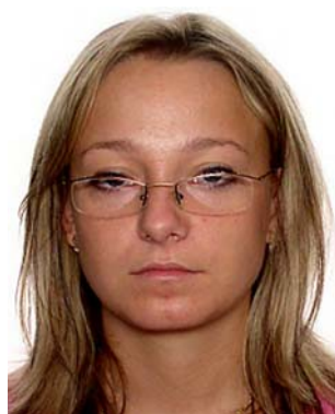
oprawka zasłania oczy