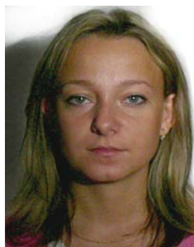
cienie w tle