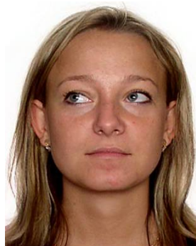
wzrok skierowany w bok

5. Tło – białe lub inne jasne jednorodne pozbawione cieni i elementów ozdobnych. Zaleca się kolor biały lub jasnoszary . Zdjęcie musi pokazywać tylko osobę fotografowaną (żadne inne osoby lub przedmioty nie mogą być widoczne).