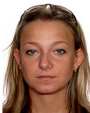
okulary na głowie

9. Nakrycie głowy – osoba fotografowana nie może być w nakryciu głowy chyba, że nakrycie noszone jest z powodów religijnych, jednak nawet w takich przypadkach cała twarz (od brody do końca czoła) musi być dobrze widoczna.