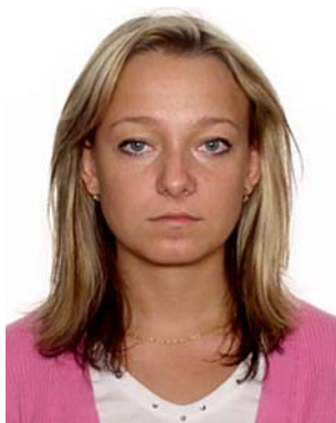
za mała głowa