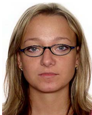
zbyt grube oprawki