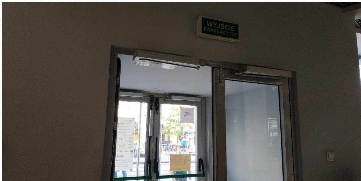
Rys. 3 Wejście główne do budynku, nad którym należy zamontować kurtynę powietrzną