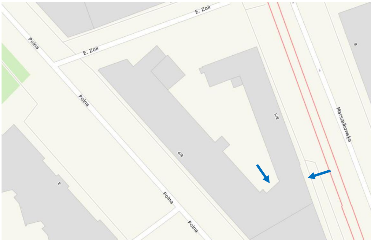
Rys. 1 Lokalizacja drzwi, nad którymi należy zamontować kurtyny powietrzne (wskazane przez niebieskie strzałki)